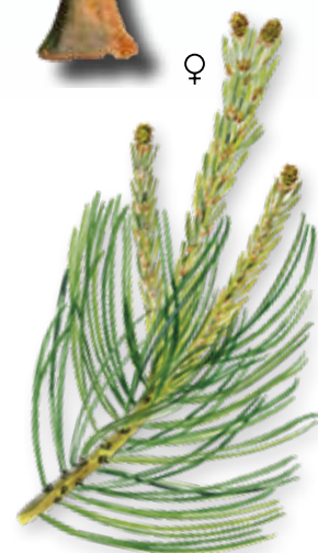
Hun- og hanblomster